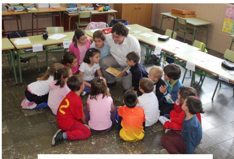
Imagen 2: Lectura en el aula

Se les pediría a los alumnos que supusiesen un contexto, que por los paisajes y