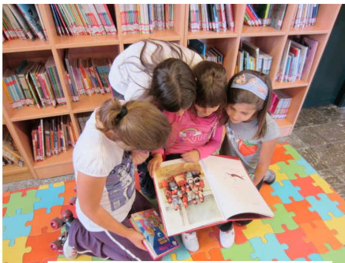
Imagen 1: Lectura en la Biblioteca

La primera girará en torno a la lectura de las dos versiones seleccionadas del cuento de Baba Yaga y la posterior comparación del tratamiento del personaje principal en ellas.