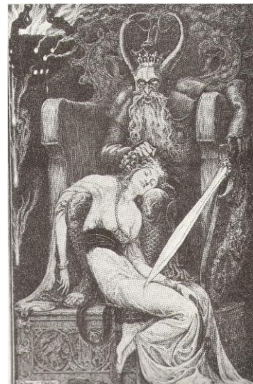
Fig.1 Thragman y Ginebra. F.C. Papé

The characters that the reader will find in this chapter are Jurgen, the protagonist; Anaitis, the Lady of the Lake, sovereign of her own island; and the Master Philologist, member of Anaitis' court. The form this chapter takes is mostly dialogue, which helps a fast reading and emphasizes the importance of the word against other means and makes abundantly clear that words are human constructs that can be used as weapons or tools, as the Philologist explains.