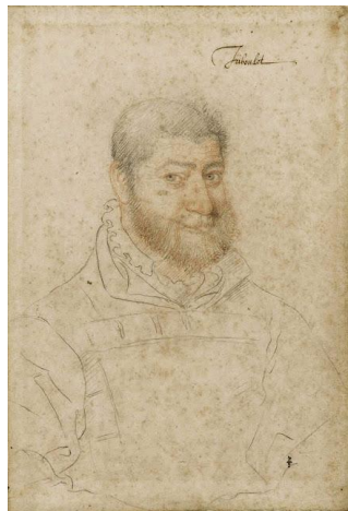
Fig. 7. Triboulet. El verdadero histórico Rigoletto

Por muy protegido del Duque que se sienta Rigoletto frente a la animadversión de los cortesanos, que con Ceprano a la cabeza preparan la venganza, su odio general hacia el mundo le ha llevado a tomar ciertas precauciones, que desgraciadamente se revelarán inútiles. He aquí otro viejo tema, aparte del donjuanismo, aunque relacionado con el mismo, del que se nutre esta singular ópera. La precaución inútil es el intento fallido de guardar algo preciado, la novia, la esposa, o la hija, en un lugar que se supone seguro, y para lo cual se toman las medidas que se