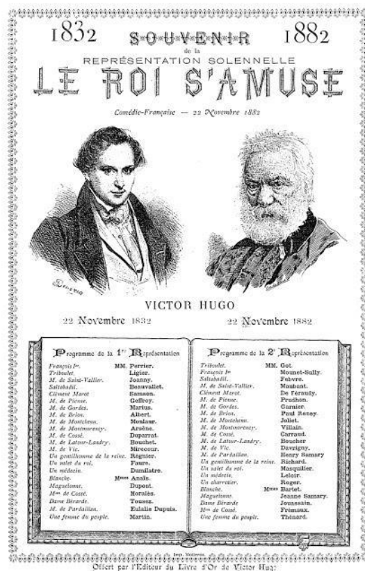
Fig.3. Cartel de Le roisàmuse

numerosos son los puntos en común entre el Don Giovanni y Rigoletto , aunque también existan grandes diferencias, pues no en balde el tiempo pasa y evolucionan los gustos.