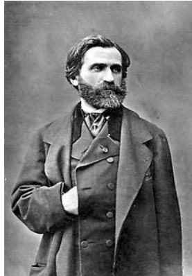
Fig. 6. Guiseppe Verdi.

superstición, tan seguida por el pueblo. De ahí, el temor de la censura y el no permitir tal título para la ópera. Pero Verdi, un temperamento dramático como pocos, supo captar la fuerza expresiva de la maldición, y por ello insistió tanto en resaltarla como el fundamento de su tragedia más allá de toda posible salvación.