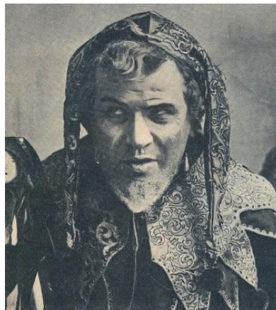
Fig. 7. TittaRuffo como Rigoletto.

dúo, y tenga lugar el vis a vis de Gilda con el Duque, que estaba escondido tras un árbol del patio, ésta le reclame que le diga su nombre: GualtierMaldè . Esa es la mentirosa respuesta del seductor, pero bien escogida para sus planes. Estudiante y pobre, como el Lindoro rossiniano. Pero el nombre de Gualterio suena aún más adecuado en el contexto de la caballería de amor. No resulta gratuito que el destinatario del tratado del Capellán se llamase precisamente Gualterio. Así se entiende que la soñadora Gilda, una adolescente que aún no ha cumplido los dieciséis años, se deleite tanto en el nombre revelado y entone el Caro nome con tanta ternura y complacencia. No es un aria para el simple lucimiento vocal, sino para la morosa delectación en la posesión del nombre querido. No se interrumpe la acción, sino que se profundiza en ella a través del sentimiento.