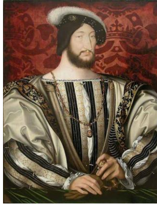
Fig. 4. Franciso I de Francia.

Elvira, la hija de Monterone (que no aparece en escena) y la Condesa de Ceprano; y por la plebeya, Zerlina, Giovanna y Maddalena. El caso de Gilda, dibujada con los atributos de la heroína romántica, es un producto típico de la evolución de los tiempos; es la incognitaborghese , pero física y espiritualmente más cercana a la nobleza que a su clase.