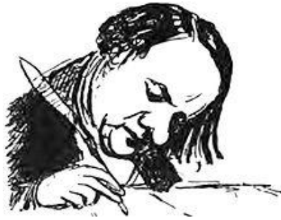
Fig. 5. Bosquejo de Hugo, por ProsperMérimée.

Si en el Don Giovanni la estatua del Comendador era el procedimiento del que se valía la Providencia para arrojar al infierno al transgresor, en Rigoletto el castigo del libertino queda impune. La maldición no se cumple en el Duque, que no le ha dado ninguna importancia a esas palabras, sino en el bufón-padre, que se ha obsesionado con ellas tan sólo oírlas. En el papel de justiciero es en lo que más se diferencia Monterone del Comendador. Si para los públicos del mítico Burlador, mayoritariamente creyentes, la estatua del Comendador estaba revestida de un poder sobrenatural, que procedía de Dios mismo, y así lo corroboraba la ortodoxia católica, que usó al personaje como encarnación de la justicia divina frente a la corrupción e ineficacia de la humana, en Rigoletto el poder de la palabra de Monterone no está tan claro que provenga de la divinidad, pues si así fuese el Duque no hubiera escapado a la condena del Todopoderoso. Al final del segundo acto, Monterone renuncia a su maldición al Duque al comprobar que a éste no le ha ocurrido ninguna desgracia, mientras que Rigoletto cierra el primer acto con la afirmación de que la maldición sobre él se está cumpliendo con el rapto de Gilda.