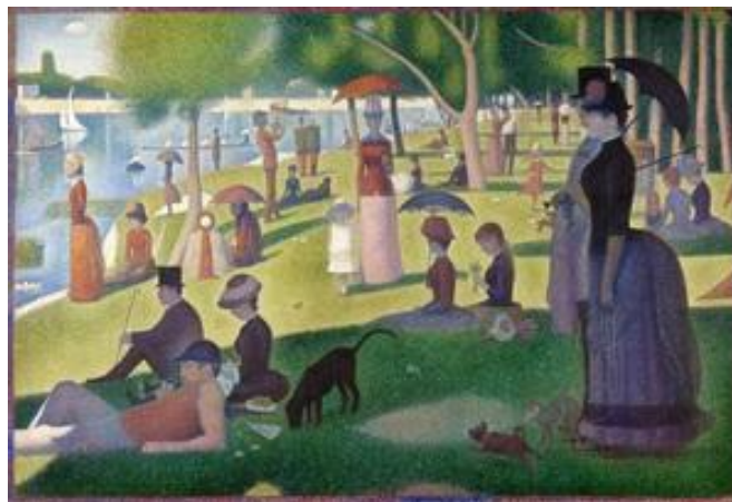
Figura 2 A Sunday on La Grande Jatte , Institute of Art, Chicago.

En su fase final, de 1886, esto es lo que se expone en el VIII Salón de París. Pero el cuadro real, el que podemos ver en el Institute of Art de Chicago mide dos metros de alto por tres de ancho. Y en la reproducción casi pasa inadvertido el mono y resulta difícil de localizar la mariposa. Cuando uno está delante del cuadro real, en Chicago, la mariposa está ahí, se ve perfectamente, la han pillado en pleno vuelo. No podemos dejar de verla porque está en un lugar privilegiado del cuadro, entre el piececito de la niña del vestido blanco y la línea de sombra que nos conduce a la espalda de la mujer del sombrero.