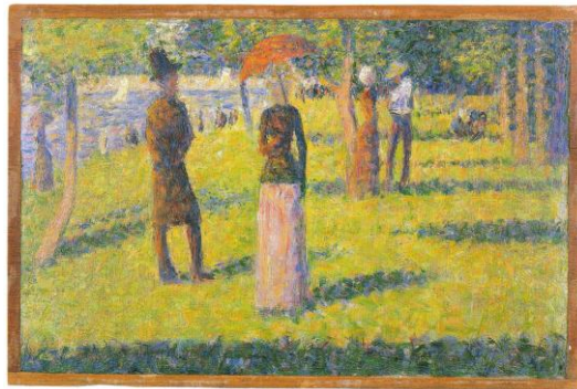
Figura 5: Landscape. Isle of La Grande Jatte. Reproducido apud R. L. Herbert: 81.

la niña de blanco que mira hacia el lugar donde debería estar el caballete del pintor. Sabemos que esa niña tampoco tiene nada que ver con la señora de la sombrilla porque, al igual que la dama del monito, la señora había sido pintada en un apunte abocetado impresionista, en ese mismo lugar y con un atuendo parecido. Pero no el mismo. Como se ve, hay un hombre de sombrero de copa que está cerca de la mujer de la sombrilla, pero no hay ninguna niña. ¿Es el mismo [ que acompaña a la dama del monito de cola en espiral? ¿O es el que está sentado en la composición de tres personas, tras la mujer y el robusto deportista tumbado y fumando en una larga pipa? En todo caso, la mujer de la sombrilla está en la misma situación central, pero sin niña. Detrás de ella hay una pareja que charla, un poco más delante de donde esté ese omnipresente árbol con tronco en forma de horquilla. El color de la sombrilla tampoco es el mismo. Y los elementos anecdóticos (el tocador de trompeta, los perros, la pareja de soldados, la mujer pescadora de la orilla) tampoco están aquí.