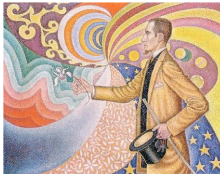
Figura 1. Paul Signac: Retrato de F. Fénéon. MOMA, New York.

Pero ¿quién es ese Félix Fénéon al que alude la estudiosa? ¿Qué valor tiene su juicio sobre Seurat? ¿En qué apoya sus análisis críticos? Félix Fénéon es el gran crítico de arte de ese fin de siglo y, como editor de La Revue Blanche acogerá en 1900 la primera gran exposición dedicada a Seurat, nueve años después de su muerte. El pintor Paul Signac hizo un sorprendente retrato de Fénéon en 1890, retrato que hoy podemos leer fácilmente como precursor del arte pop de los años 60 y de la estética que asociamos a los dibujos del Submarino amarillo de los Beatles. Vale la pena rescatar este cuadro para entender la frescura.