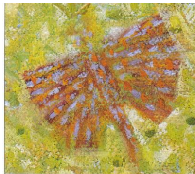
Figura 3. Detalle ampliado de la mariposa.

Lo interesante es que esta mariposa no estaba en el cuadro en la fase de diciembre de 1884. Se añadió en 1886. ¿Por qué?